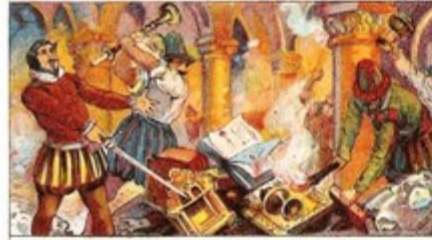
De Beelastomers of Calvinisten verwoesten de Kerken (1566).