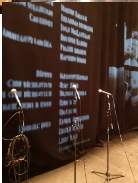
Essais de scénographie au Théâtre Châteaouvallon, Toulon, janvier 2021.