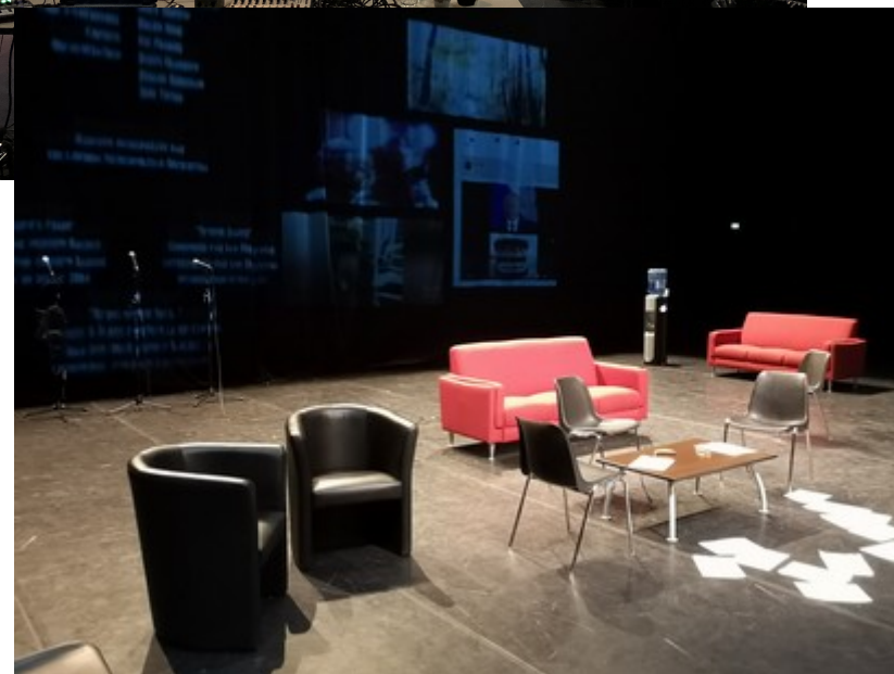
Essais de scénographie au Théâtre du Bois de l'Aune, Aix-en-Provence, novembre 2020.